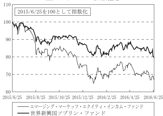
組入ファンドの価格推移

期を通じ、国別の投資配分は、中国や南アフリカなどが上位を占めました。また、業種別では、金融セクターや電気通信サービスセクターなどが投資配分比率の上位となりました。