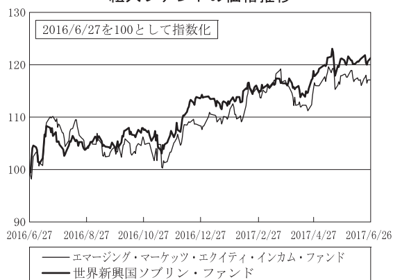
組入ファンドの価格推移

期を通じて、国別の投資配分は、中国や南アフリカなどが上位を占めました。また、業種別では、金融セクターや電気通信サービスセクターなどが投資配分比率の上位となりました。